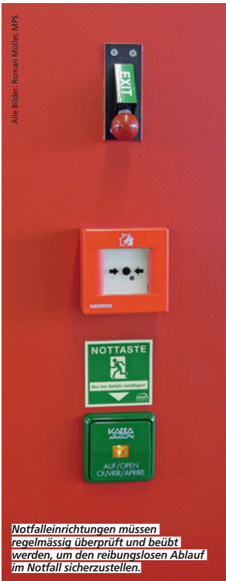
Notfalleinrichtungen müssen regelmässig überprüft und beübt werden, um den reibungslosen Ablauf im Notfall sicherzustellen.

In einem Betrieb gibt es die verschiedensten Konzepte und Ansätze für das Verhalten in einem Notfall. Doch funktionieren diese im Ereignisfall? Erst ein perfektes Zusammenwirken der einzelnen Ansätze schafft integrale Sicherheit.