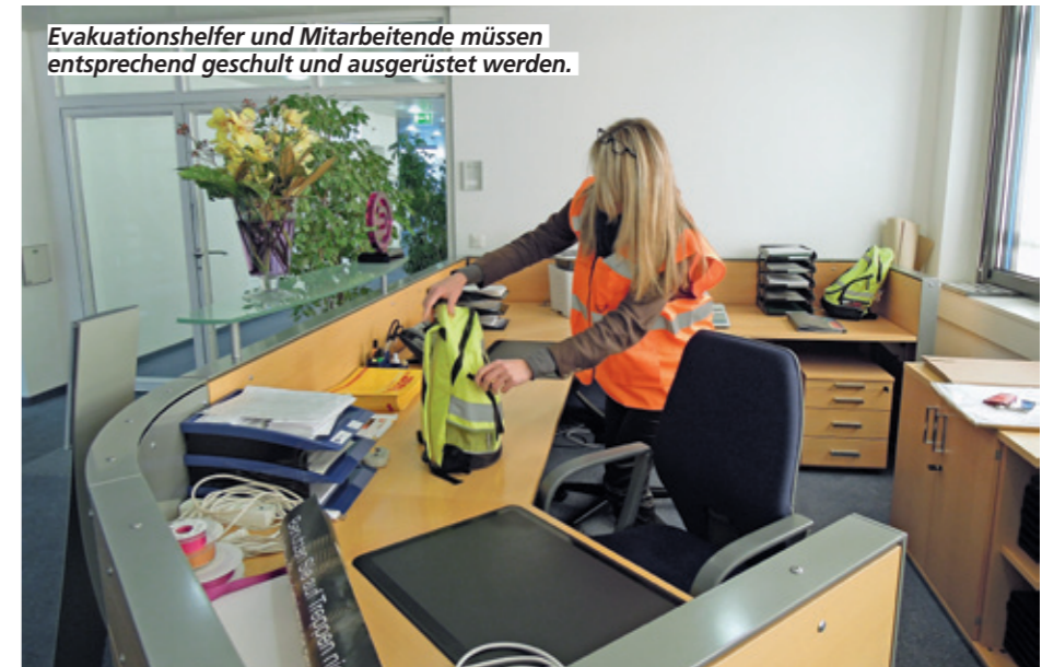
Evakuationshelfer und Mitarbeitende müssen entsprechend geschult und ausgerüstet werden.

Diese Informationen müssen zwingend kurz vor der Evakuationsübung erfolgen. Die Erfahrung hat gezeigt, dass eine Anmeldung mehrere Tage oder Wochen im Voraus nicht immer durchgängig funktioniert.