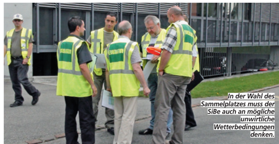
In der Wahl des Sammelplatzes muss der SiBe auch an mögliche unwirtliche Wetterbedingungen denken.